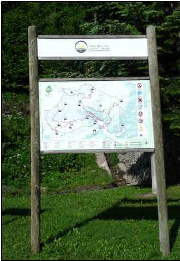
Nou element de senyalització informativa de les rodalies del dic d'Arinsal

L'any 2011 s'ha creat un nou element de senyalització informativa a les rodalies del dic d'Arinsal, amb l'objectiu de complementar les tasques informatives de l'equipament per a l'atenció dels visitants, especialment quan aquest no es troba en funcionament, atès que s'hi troba adjacent. Aquest element inclou un mapa detallat del parc, amb el recorregut dels senders que es consideren bàsics per a l'ús públic, i ofereix informació sobre la normativa que cal contemplar en la visita a l'espai. Enguany també s'ha refet, entre altres elements de senyalització, el mirador panoràmic del roc de la Sabina, destruït a final de 2010 per un acte vandàlic. Alhora, s'ha instal·lat, en aquest mateix indret, un cartell interpretatiu del projecte nacional d'Andorra Turisme "Natura en Ruta".