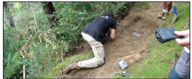
Instal·lació de l'ecocomptador al camí del coll de les Cases