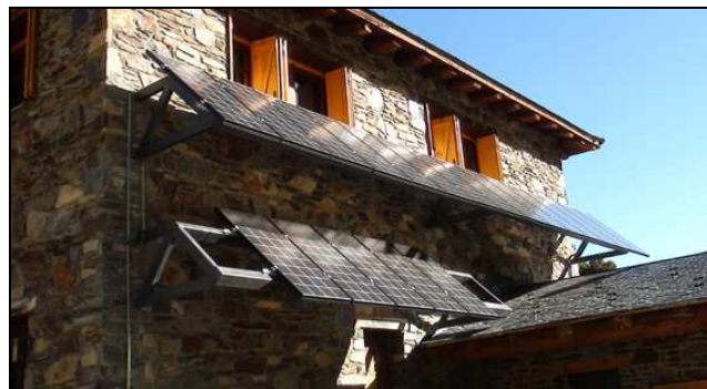
Aspecte parcial del sistema energètic fotovoltaic, a dalt, i de l'estació de tractament d'aigües residuals, a baix, del refugi de Comapedrosa

Una de les actuacions més rellevants d'aquest any ha estat l'execució de les obres de millora del refugi de Comapedrosa. Aquestes, que han estat realitzades pel Ministeri encarregat del Patrimoni Natural, institució que forma part de l'Òrgan Rector del parc, han inclòs la construcció d'una estació de tractament de les aigües residuals, la instal·lació d'un sistema energètic fotovoltaic, la realització de noves divisions interiors i la col·locació de porticons de fusta a la part exterior. Afegir, a més, que enguany també s'ha millorat la captació d'aigua del refugi de les Fonts, amb l'objectiu de què el bestiar no desencebeï la conducció i que la font no es quedi sense aigua, i s'ha corregit la integració paisatgística de la caseta de captació d'aigua del Pla de l'Estany.