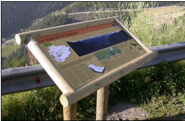
Cartell interpretatiu del projecte "Natura en Ruta"