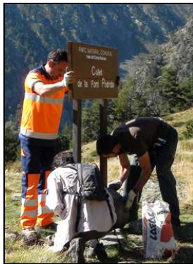
Cartell orientatiu de les rodalies de l'Estany Negre, reinstal·lat el 2011, a l'esquerra, i fotografia realitzada durant les tasques de correcció del cartell orientatiu del collet de Font Podrida, a la dreta