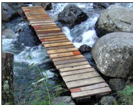
Pont de fusta temporal, instal·lat el 2011, per unir el Circuit Interpretatiu i l'àrea de berenada del riu Pollós

Aquest butlletí està obert a la publicació de les opinions dels seus lectors. Podeu dir la vostra enviant un correu electrònic a francescvela@comumassana.ad , o mitjançant una carta a la següent adreça: Parc Natural Comunal de les Valls del Comapedrosa. Comú de la Massana. Avda. Sant Antoni, 29. La Massana. AD400. Principat d'Andorra.