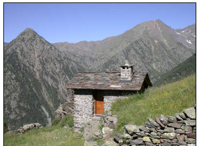
Borda de Torné, propietat privada adjacent a l'espai protegit