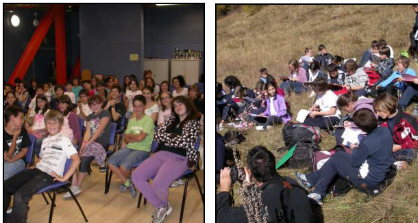
Fotografies realitzades durant les activitats educatives amb els alumnes de l'Escola Andorrana de la Massana, a l'esquerra, i del Col·legi Internacional del Pirineu a la dreta

-La participació global a totes les activitats organitzades o coorganitzades des del parc durant el 2011 correspon, sense tenir en compte les activitats dirigides al públic escolar, a un total de 480 persones, xifra no assolida en cap dels anys anteriors.