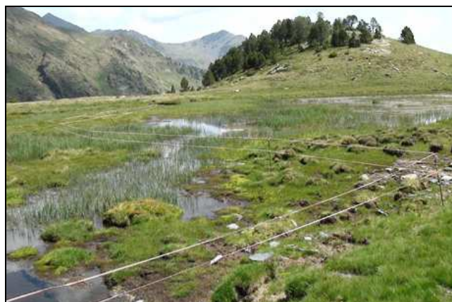
Aspecte del tancament parcial de la mollera de la bassa de les Granotes

Durant el 2011 s'ha dut a terme, a títol de projecte pilot, el tancament parcial de dues molleres de la capçalera de la vall de Comapedrosa (bassa de les Granotes i rodalies de la Pleta de Comapedrosa). Aquesta actuació s'ha realitzat amb la col·laboració del Parc Natural de la Vall de Sorteny i el Departament de Medi Ambient del Govern d'Andorra, i cerca la millora de l'estat de conservació d'aquests interessantíssims medis biològics. El tancament, basat en la instal·lació de piquetes, isoladors i filats, i amb un perímetre total d'uns 500 m, s'instal·là el 28 de juny i s'extragué el 28 de setembre.