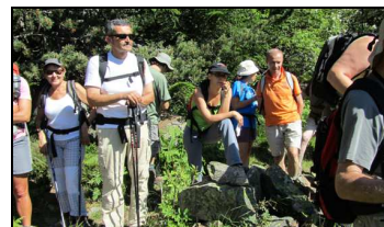
Fotografia realitzada durant el curs de flora, a l'esquerra, i durant la Nit de les papallones nocturnes d'Andorra, a baix

Alhora, durant el 2011 s'ha organitzat una sortida per observar la serenalla pallaresa (13 d'agost), la Nit de les papallones nocturnes d'Andorra (25 d'agost), activitat organitzada en col·laboració amb el CENMA (Centre d'Estudis de la Neu i de la Muntanya d'Andorra) de l'Institut d'Estudis Andorrans, la celebració del Dia Mundial dels Ocells (1 d'octubre) i la presentació de l'audiovisual "Un any al Comapedrosa" al teatre de les Fontetes (16 de novembre), projecte elaborat per BIOCROM (Biologia i Comunicació SL).