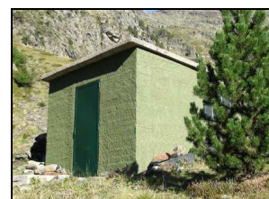
Resultat de la millora del còm del refugi de les Fonts, a l'esquerra, i aspecte actual de la caseta d'aigües del Pla de l'Estany, a la dreta