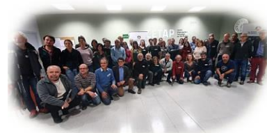
Taller participatiu sobre el pla d'acció preliminar del Parc Pirinenc de les Tres Nacions

L'objectiu del taller era definir l'escenari de futur que es vol assolir per a cadascun dels àmbits de treball, i establir les accions que es duran a terme.