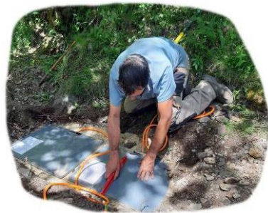
Instal·lació d'un dels nous ecomptadors al Circuit Interpretatiu

Les dades recollides per la xarxa d'ecomptadors de l'espai, que també inclou el del camí del coll de les Cases , instal·lat l'any 2011, permeten aprofundir en el coneixement de l'ús públic .