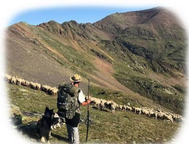
Ramat d'ovelles a la vall de Comapedrosa

Segons les dades de les guàrdies comunes, un total de 43 caps de bestiar boví i 12 caps de bestiar equí han pasturat, durant el 2019, pels sectors del Pla de l'Estany i les Fonts.