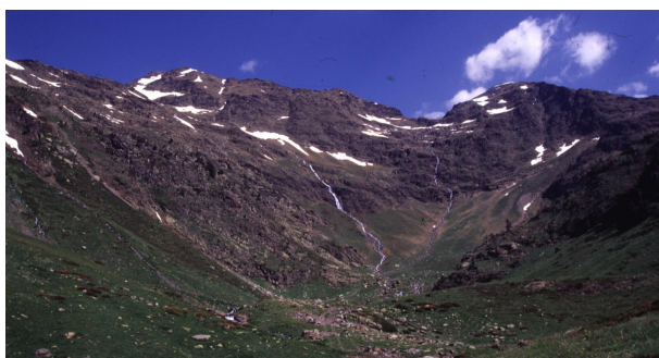
Pla de l'Estany (Josep Argelich . BIOCUM)

3.- L'estany del pla de l'Estany: l'estany i el circ glacial del pla de l'Estany conformem un dels indrets més bells i espectaculars del parc. Entre la vegetació herbàcia que catifa aquest indret s'encuentren espècies com la dent de ca, el ranuncle pirinenc, la flor de pastor, la soldanel·la alpina i la primula integrifolia, totes elles força abundants poc després de fondre's la neu. Al nord de la pleta descansa el refugi del pla de l'Estany, també anomenat refugi Joan Canut.