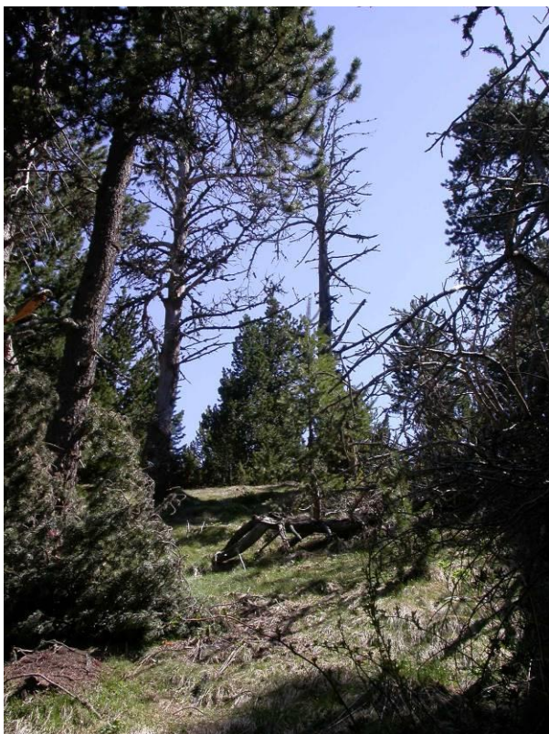
Rodalies del coll de les Cases

2.- Els prats del coll de les Cases i la vegetació calcícola: a l'extrem sud del parc, a les rodalies del coll de les Cases, el sòl és calcari, a diferència del que succeeix a la major part del parc. La vegetació que s'hi fa, doncs, és diferent. Cal destacar que les pinedes de pi negre calcícoles, com les que podem observar des dels prats del punt final de l'itinerari, es consideren un Hàbitat d'Interès Comunitari Prioritari.