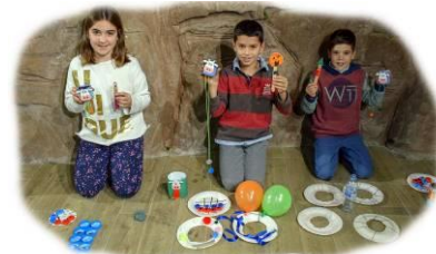
Taller de fabricació d'un hotel per a insectes del 25 d'agost de 2018, a l'esquerra, i taller de reciclatge i creació de jocs del 21 de novembre de 2018, a la dreta