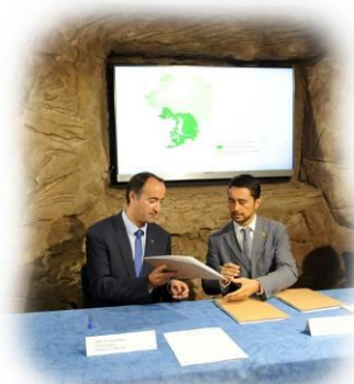
Acte de signatura del protocol de creació del Parc Pirinenc de les Tres Nacions

El Parc Pirinenc de les Tres Nacions suma més de 428.700 hectàrees . Inclou el Parc Natural de l'Alt Pirineu, el Parc Naturel Régional des Pyrénées Ariégeoises, el Parc Natural de la Vall de Sorteny i el Parc Natural Comunal de les Valls del Comapedrosa, que compartiran experiències en matèria de sostenibilitat i patrimoni natural .