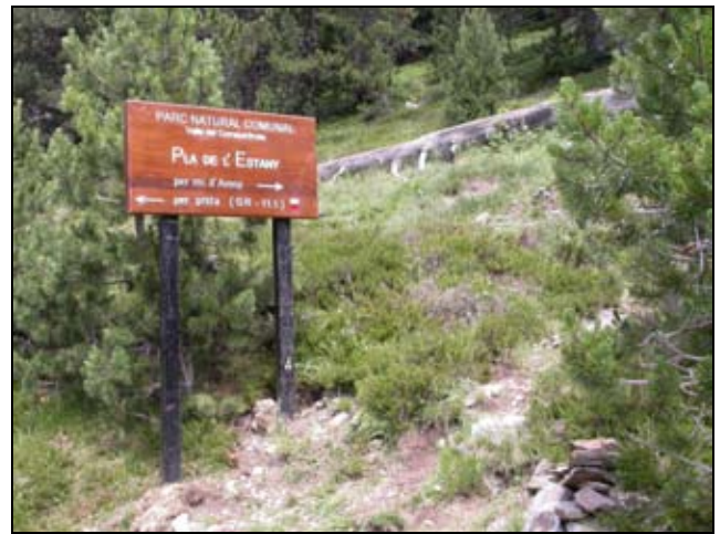
Nou element de senyalització orientativa del camí del rec d'Areny