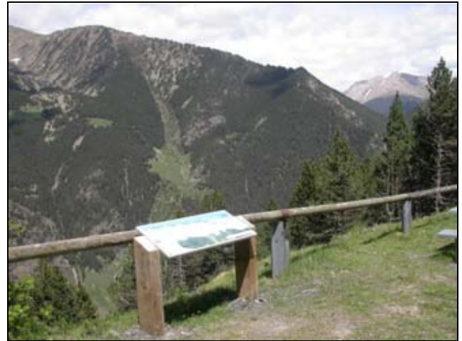
Mirador del roc de la Sabina

un nou element de senyalització interpretativa.