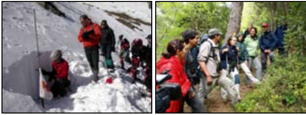
Fotografies realitzades durant la sortida per reconèixer zones d'allaus, a l'esquerra, i en la sortida de camp del taller de fauna vertebrada del Dia mundial de la Biodiversitat, a la dreta

llibre fotogràfic, joc de memòria, trencaclosques, etc.) del Parc Natural Comunal de les Valls del Comapedrosa també es comercialitzaren des de l'equipament per a l'atenció dels visitants del Parc Natural de la Vall de Sorteny.