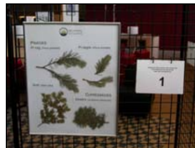
Detall de l'exposició de l'herbari a la Biblioteca comunal

L'any 2009 es preparà un herbari d'exposició dels arbres i arbusts del parc, que inclou, en un total de 10 plafons, 41 espècies diferents. Aquest herbari s'exposà entre el 2 de desembre de 2009 i el 6 de gener de 2010 a la Biblioteca comunal. Els plafons s'acompanyaren d'un fulletó específic que informa sobre els usos tradicionals de cada espècie, la seva distribució, etc.