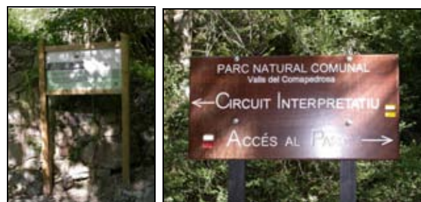
Nous elements de senyalització del Circuit Interpretatiu instal·lats durant el 2009