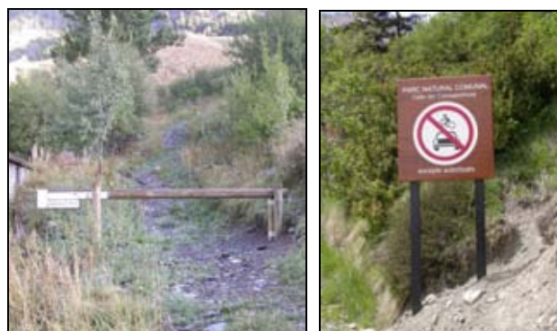
Barrera mòbil instal·lada a la part baixa del camí de Percanela-les Fonts, a l'esquerra, i cartell que informa de la regulació de l'accés motoritzat a l'inici de la pista del Pla de l'Estany, a la dreta

Altres actuacions relacionades amb el control de la circulació motoritzada i executades durant el 2009, són la instal·lació d'una barrera mòbil a la part baixa del camí esmentat al paràgraf anterior, i de cartells que informen de la restricció d'accés motoritzat en aquesta mateixa via, així com a la pista del Pla de l'Estany i al camí del Coll de les Cases.