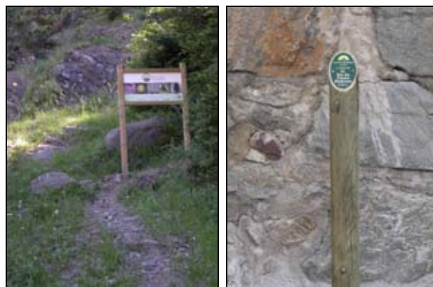
Un dels dos cartells nous de benvinguda instal·lats el 2009, a l'esquerra, i element de senyalització orientativa de Seven peaks , a la dreta, programa creat per l'ADHA (Associació d'Hotelers d'Andorra), en col·laboració amb Andorra Turisme, que proposa l'ascensió al cim més alt de cada una de les set parroquies del país

-“Exposició en forma d'herbari”, títol de “La proposta” del Periòdic d'Andorra del 24 i 25 de desembre.