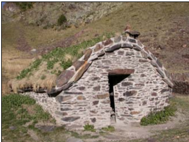
Aspecte de la cabana de Comapedrosa després de les tasques de restauració

Durant el 2009 es restaurà la cabana de Comapedrosa, actuació que afectà tant l'interior (llar de foc, per exemple) com l'exterior (englevat del sostre, arrebossat de les parets, xemeneia, etc.) d'aquesta infraestructura tradicional. L'actuació esmentada, que cerca la conservació del patrimoni i les activitats tradicionals, juntament amb la difusió dels valors de l'espai, també inclogué la construcció d'una petita pleta prop de la cabana, a poca distància de la pleta original, d'elevat valor històric i cultural.