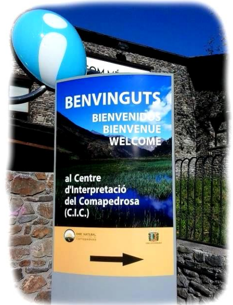
Fotografies de l'interior del CIC (Centre d'interpretació del Comapedrosa), a l'esquerra, i de l'exterior a dalt