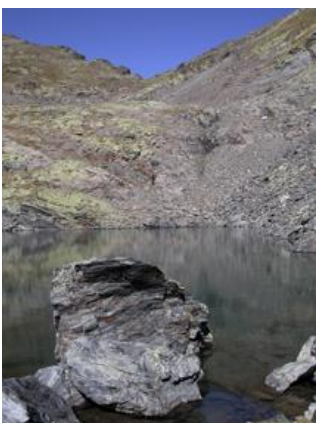
Estany de Montmantell