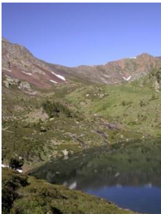
Estany de les Truites